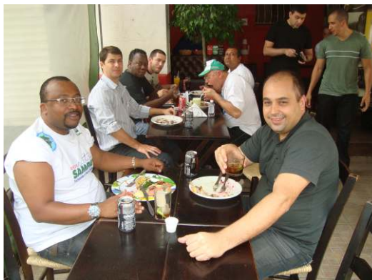
Interação com catadores.

- Em reuniões, são identificados problemas em comum e o grupo de trabalho formado pelas cinco entidades tem a missão de analisar, definir plano de trabalho e atuar na busca de soluções;