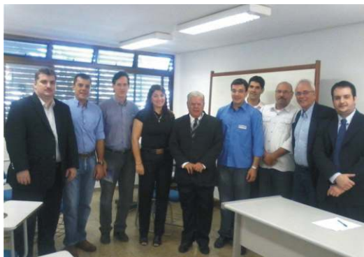
Encontro com o...

Nossas propostas de trabalho e iniciativas já apresentam resultados positivos em diversas frentes